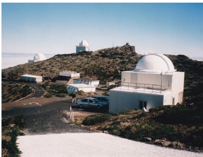
Solobservatoriet på Roque de Muchachos