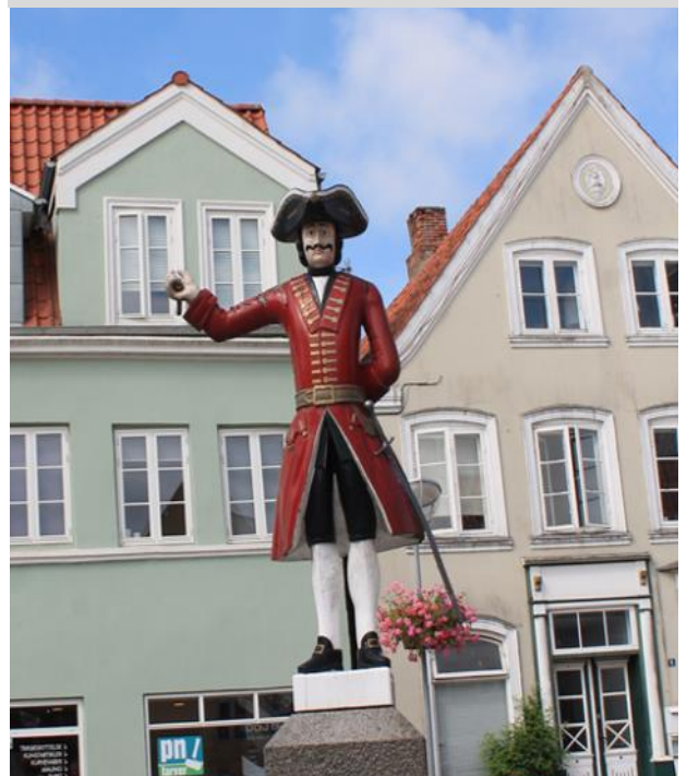
Kagmand : en figur som man på vissa ställen ställde på stadens "kag" / skampål för att den skulle påminna folk att följa lagen. Den sista kagmanden i Tønder är från 1669 och är den enda bevarade i landet. Den finns på museet och på torget står en kopia.

bl.a. "Den stora engelska sprutan". Dessa sprutor krävde bemanning för att man skulle kunna dra dem genom gatorna. Bemanningen skedde genom tillfälliga åtaganden men 1837 fastställdes det att man skulle inrätta en brand- och vaktkår. 1844 upphöjde man denna kår till den första frivilliga brandkåren i Norden.