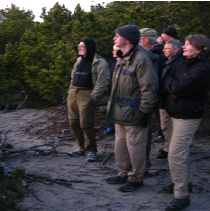
Blickarna på den nedgående solen på Sandön 2009.