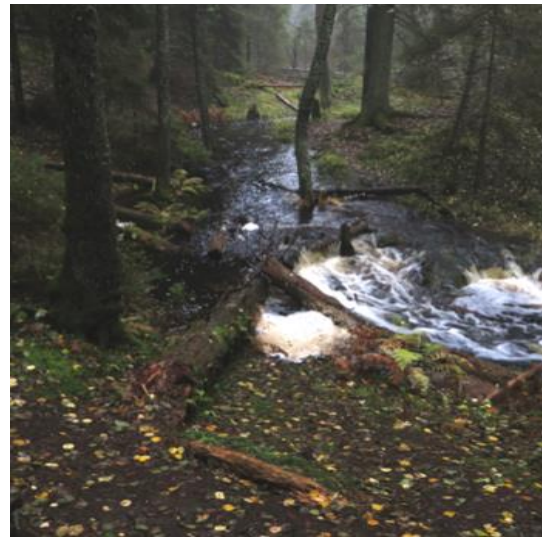
Bylsjöbäcken I Tyresta