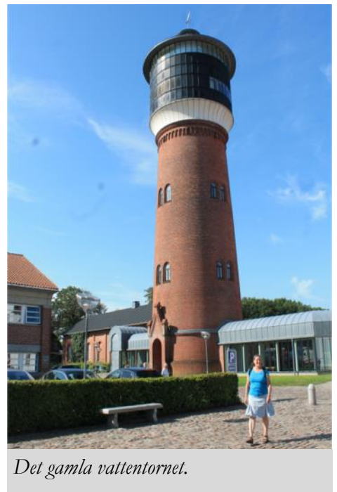
Det gamla vattentornet.